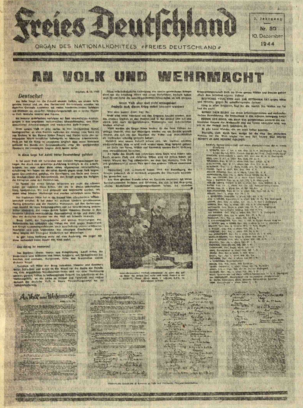
Первая страница газеты «Свободная Германия» № 50 от 10.XII.1944 г.

Наличие больших запасов газа открывает большие перспективы для развития химической промышленности и промышленности строительных материалов. Нет сомнения, что в недалеком будущем на базе саратовских газовых месторождений развернется строительство новых фабрик и заводов.