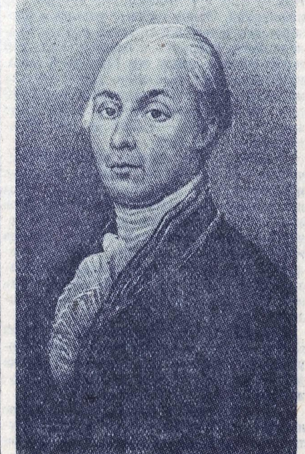
А. Н. Радищев.

Первый концерт академической капеллы состоится сегодня в Большом зале Консерватории им. П. И. Чайковского. В программе концерта — произведения русских и западно-европейских классиков, произведения советских композиторов и русские народные песни.