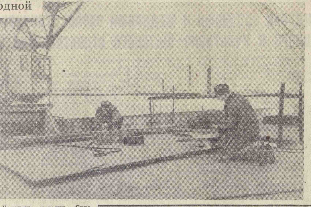
Будапешт сегодня. Судостроительный завод «Обуда». НА СНИМКЕ: на строительстве речного парохода.