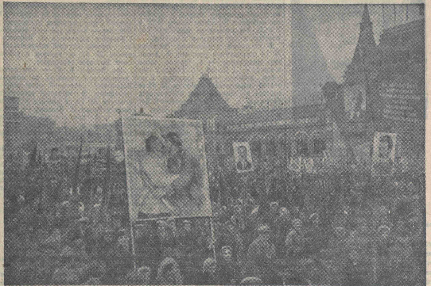
Празднование XXII годовщины Великой Октябрьской социалистической революции. Демонстрация трудящихся на Красной площади 7 ноября 1939 г.

Объезд войск закончен. Товарищ Ворошилов поднимается на трибуну мавзолея.