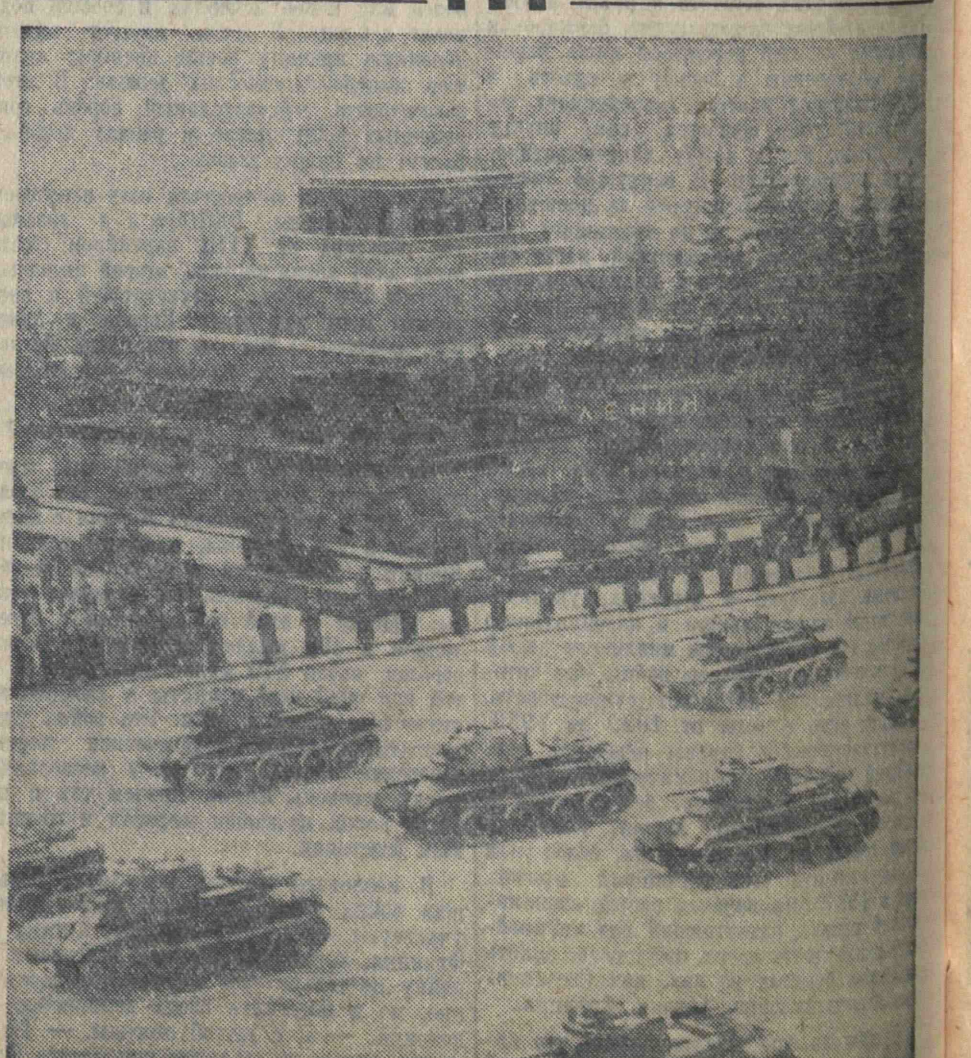
Парад на Красной площади 7 ноября 1939 г. На снимке: марширующие танки.