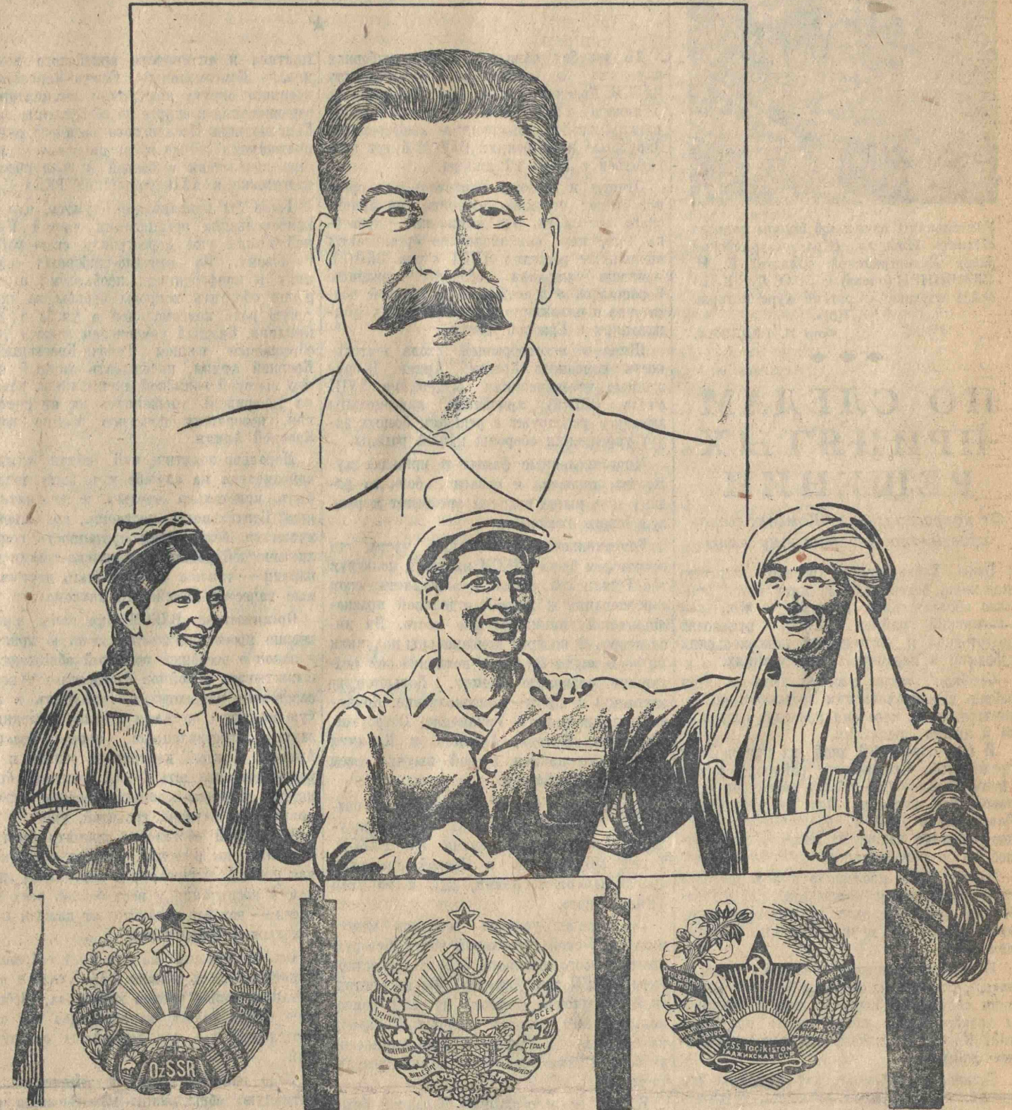
Рис. Н. ЛИСА.