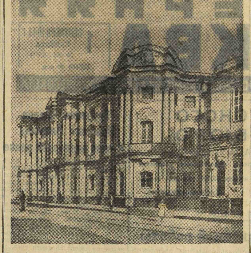
Архитектурные памятники столицы

Отмеченные бригадой случаи не единичны. В этот день работники Госавтоинспекции в различных пунктах города обнаружили свыше ста технических неисправностей легковых и грузовых автомобилей. Эти факты говорят о безответственном отношении к своим обязанностям многих руководителей автохозяйств и водителей машин. Винюные привлечены к строгой административной ответственности. Тот, кто выпускает в рейс или ведет технически неисправную машину, подвергается риску быть виновником и жертвой аварии и несчастного случая. На улицах города не должно быть ни одной автомашины, угрожающей безопасности движения. Автотранспорт столицы должен быть образцовым. Бригада «Вечерней Москвы», Госавтоинспекции и ОРУДА: Г. ПЕТРОВ, Р. КИСЕЛЕВ, М. ЛЕВИНСОН, Б. РОМАНОВ.