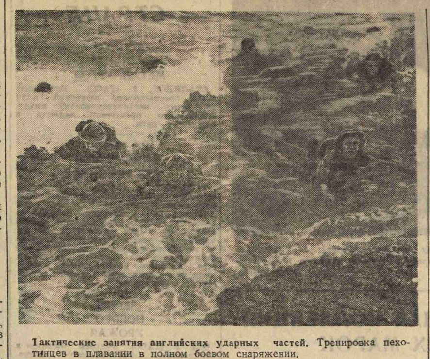
Тактические занятия английских ударных частей. Тренировка пехотинцев в плавании в полном боевом снаряжении.