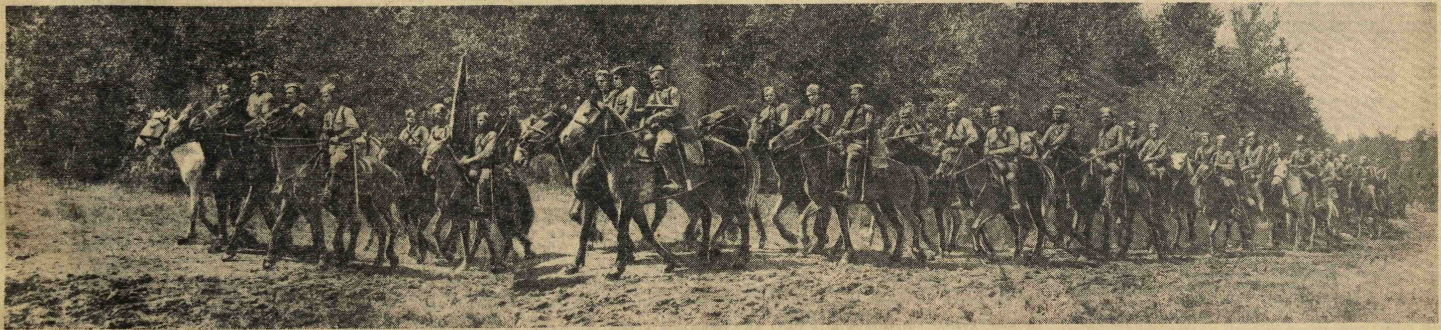
Западный фронт. Кавалерия в походе.