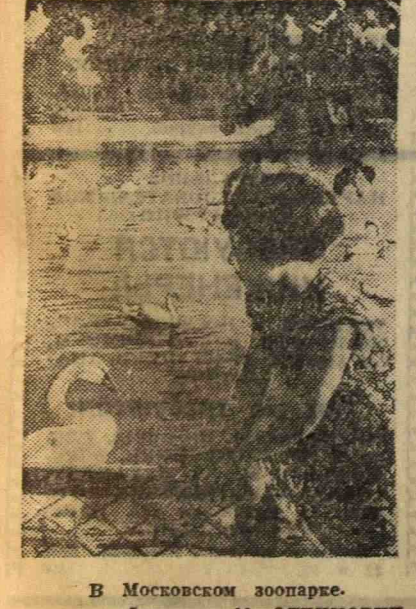
В Московском зоопарке.

Театр покажет там же пьесу лауреата Сталинской премии А. Корнейчука «Степаша Украиня». Спектакль поставлен художественным руководителем театра Ю. Юрьевым.