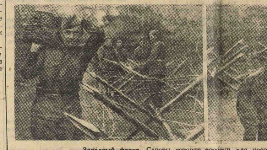
Западный фронт. Саперы готовят рогатки для проволочных заграждений.

В плохую погоду ребята будут проводить занятия в учебно-игровых комнатах. Ребята с нетерпением ожидали открытия детской площадки (Клинический пер. дом № 2) и сейчас, когда малая клает последний малюк кисти на дверь террасы, несколько пар счастливых детских глаз с удовольствием смотрят на его работу. Н. Ч.