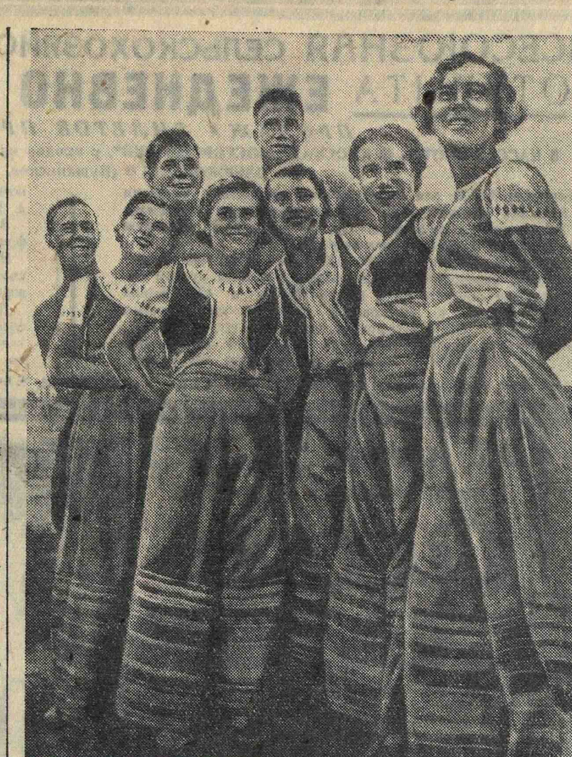
Физкультурники двенадцатой союзной республики — карело-финны, прибывшие на парад.

Сейчас разрабатывается технический проект новой станции. Все основные чертежи представляется сдать до конца этого года.