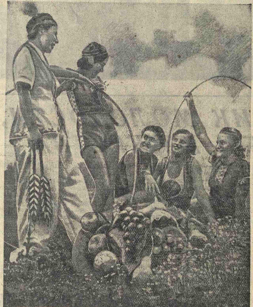
Физкультурники Казахстана, Грузии и Туркмени.

В Сокольническом парке культуры состоится праздник посвященный автомотоспорту и мотоциклизму. Спорт