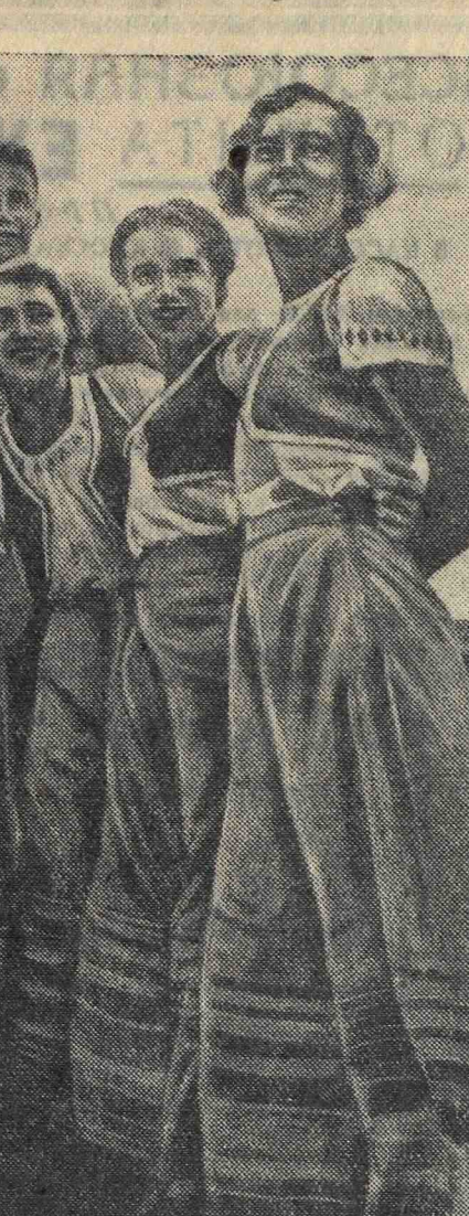
Физкультурники двенадцатой союзной республики — карело-финны, прибывшие на парад.

В сборник войдут 2 1/2 тысячи дореволюционных и советских частушек. В старых частушках отражается жизнь рабочих и крестьян до революции: речухина, солдачина, тяжелая женская доля, отходничество на промыслах. Дается также рабочая частушка, любовная и плясовая. В советской частушке находят свое отражение все стадии жизни нашей страны с первых дней Великой Октябрьской социалистической революции до наших дней.