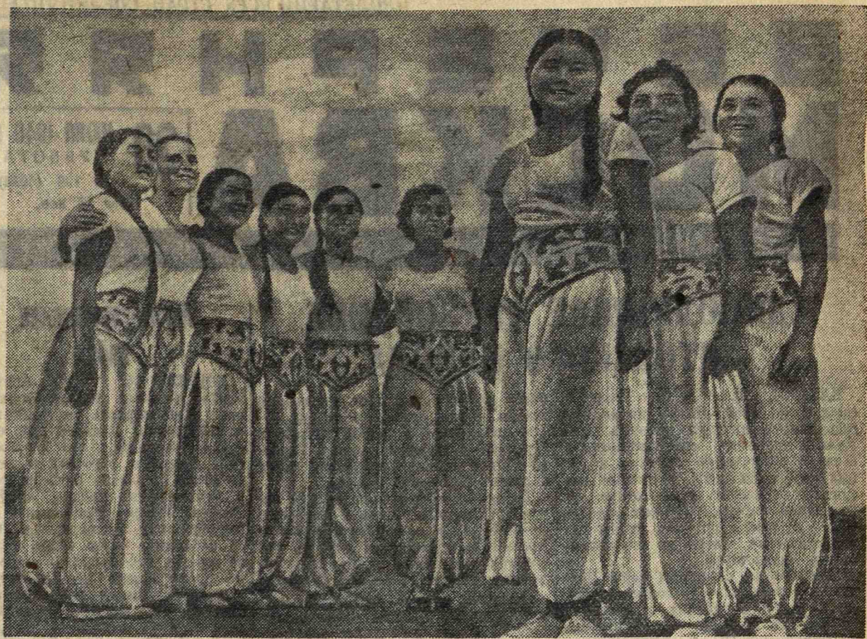
Физкультурницы Киргизской ССР.

Дирижировать сводным оркестром инструктор оркестров Красной Армии комбриг С. А. Чернецкий.