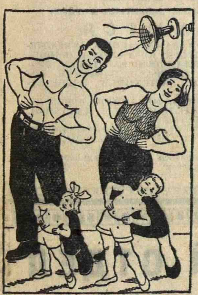
Спортсмены и их спортсмена.

«Бодельщик» недоволен хваткой: — Легко ль? В СССР штангисты — По совместительству... танкисты!