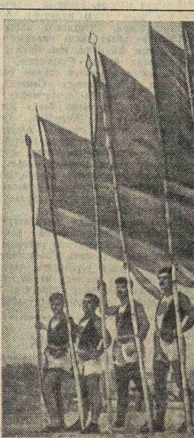
Знаменосцы спортивной делегации Грузинской ССР.

Заводской совет физкультуры впервые в этом году работает в тесном контакте с Осоавиахимом. Эта связь обеспечивает сочетание физической и военной подготовки молодежи и дает возможность готовить из среды физкультурников выносливых, отважных будущих бойцов.