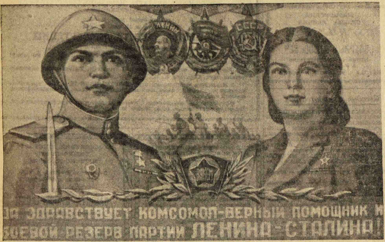
Паннат работы художника В. Правдина, выпущенный Военгизом к 30-летию ВЛКСМ.