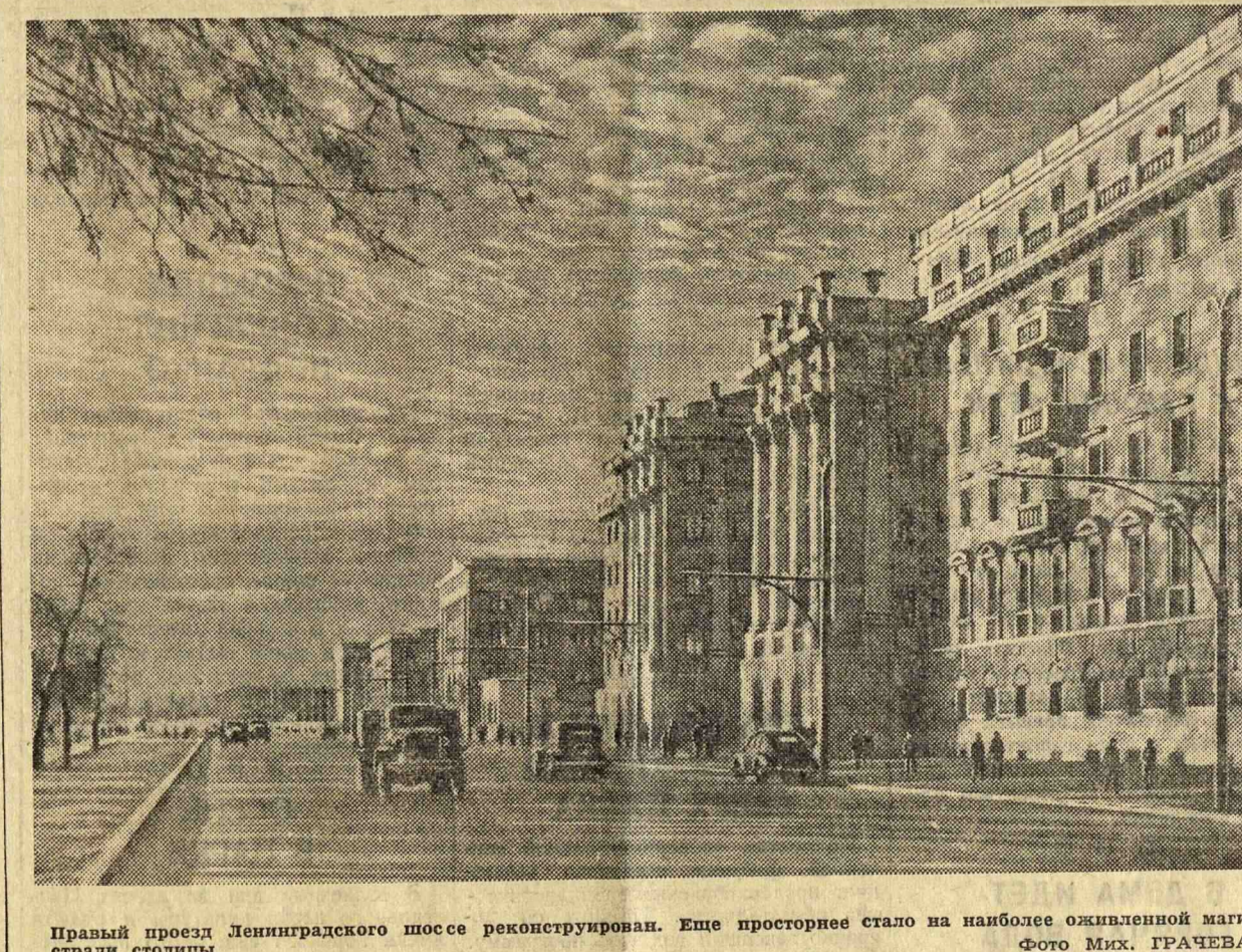
Правый проезд Ленинградского шоссе реконструирован. Еще просторнее стало на наиболее оживленной магистрали столицы.

В связи с этим значительно снизилась цена на картофель — до 15 процентов, на капусту — на 10—12 процентов и на морковь, свеклу и огурцы — от 15 до 18 процентов.