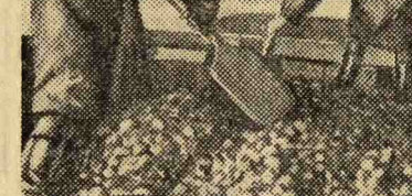
Управление промторгов Москвы завершило выполнение плана закупа картофеля. НА СНИМКЕ: закладка картофеля на хранение в Калининском райишгороде.

Сегодня ночью на большей части европейской территории СССР преобладала малооблачная холодная погода. В юго-западных районах центральной полосы и на юге Урала местами прошли слабые кратковременные дожди. В Коми АССР и на востоке Архангельской области местами шел слабый снег. Температура воздуха сегодня в 9 часов утра была в Мурманске 0, Архангельске, Ленинграде и Киеве 3, Смоленске и Харькове 4, Риге и Саратове 6, Куйбышеве 7, Чкалове 8, Саратове и Свердловске 10, Ереване 19, Ташкенте 22 гр. тепла. Минимальная температура сегодня ночью в Москве была 0, в 12 часов дня 7 гр. тепла. Завтра в Москве, по сведениям Центрального института прогнозов, ожидается небольшая облачность, без осадков. Температура ночью 0—2 гр. мороза, днем 9—11 гр. тепла.