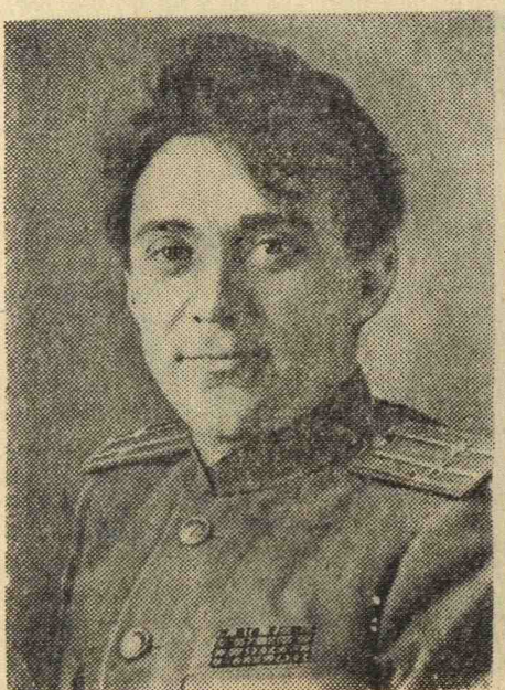
Б. Н. Полевой. Писатель.