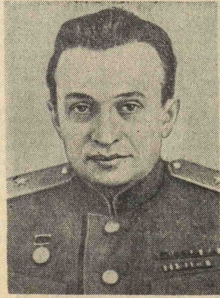
А. И. Микоян. Конструктор.