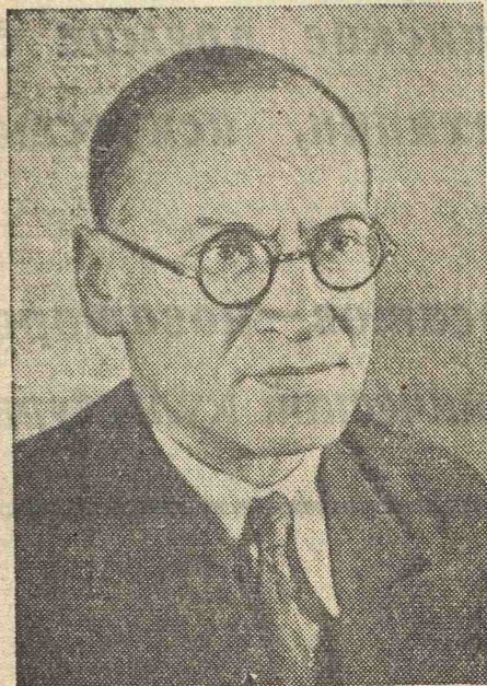
Я. И. Френкель. Член-корреспондент Академии наук СССР.