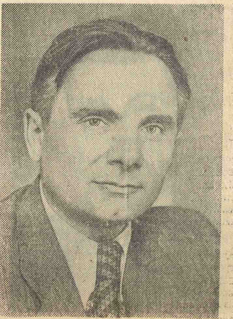
М. М. Крушельницкий. Режиссер.