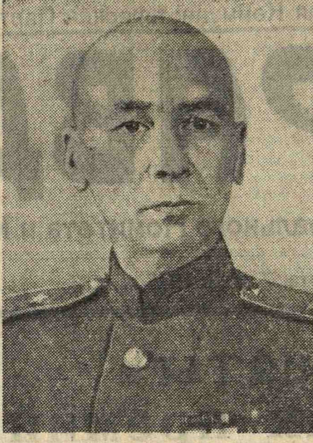
Н. Г. Хлопов. Действительный член Академии медицинских наук СССР.