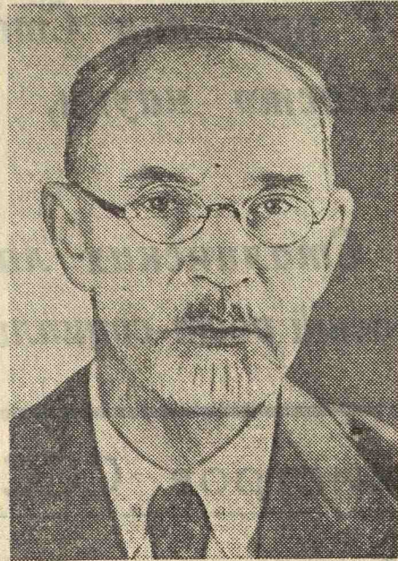
А. Е. Арбузов. Академик.