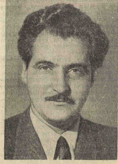
К. М. Симонов. Писатель.