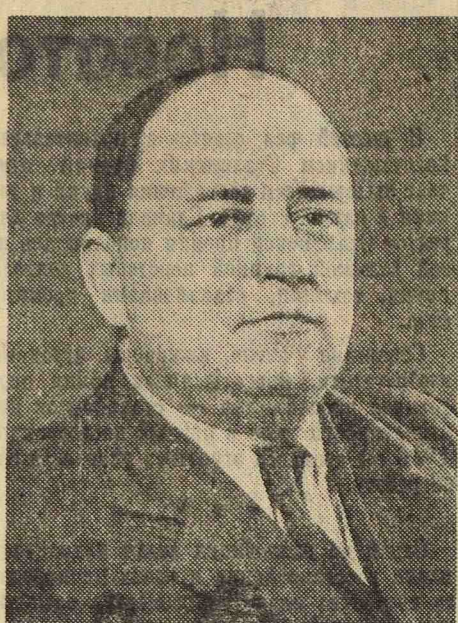
В. Я. Шебалин. Композитор.