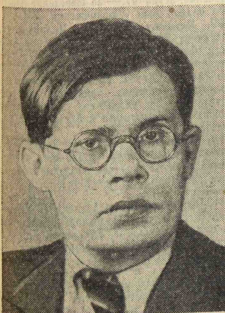
Н. Н. Боголюбов. Член-корреспондент Академии наук СССР.