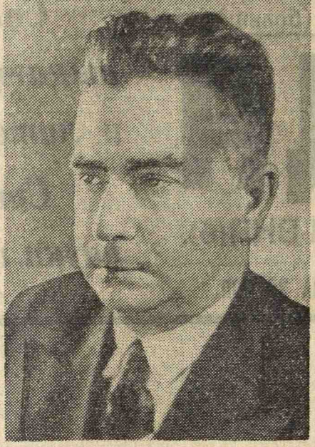
С. Н. Джанашиа. Академик.