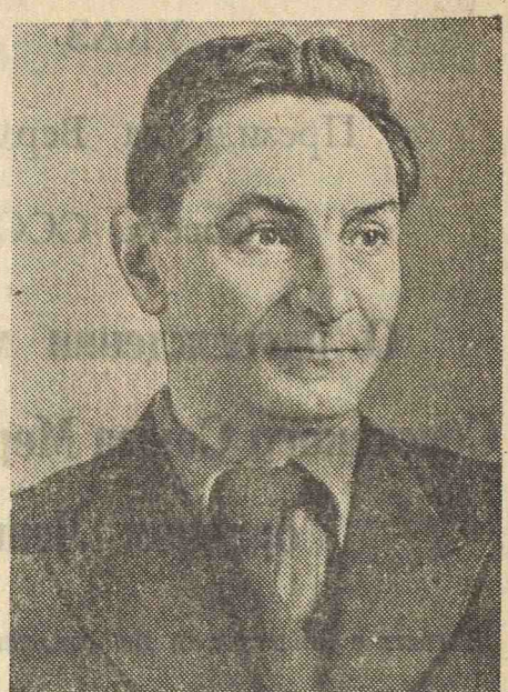
В. И. Пудовкин. Кинорежиссер.