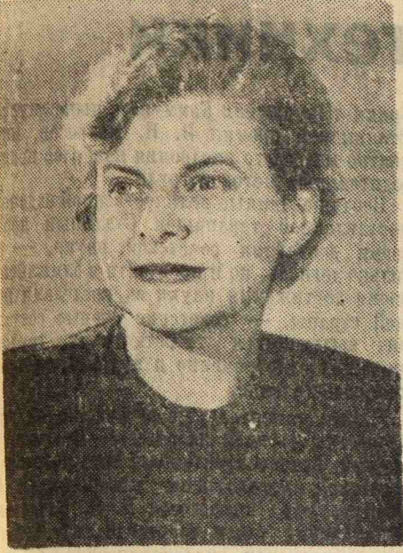
В. Ф. Панова. Писательница.