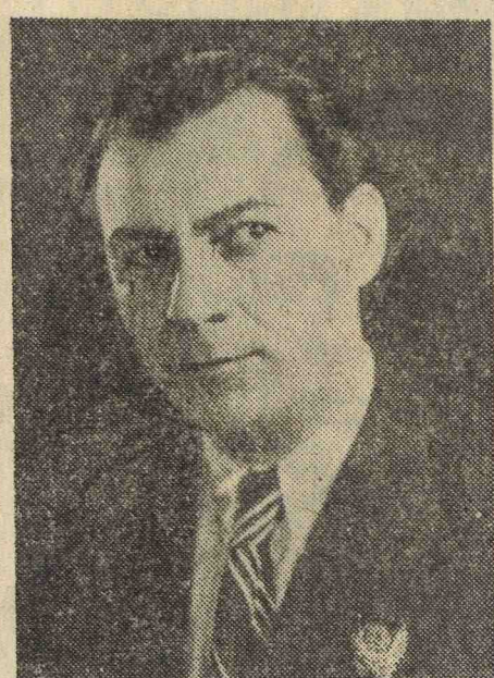
М. Г. Геловани. Артист.