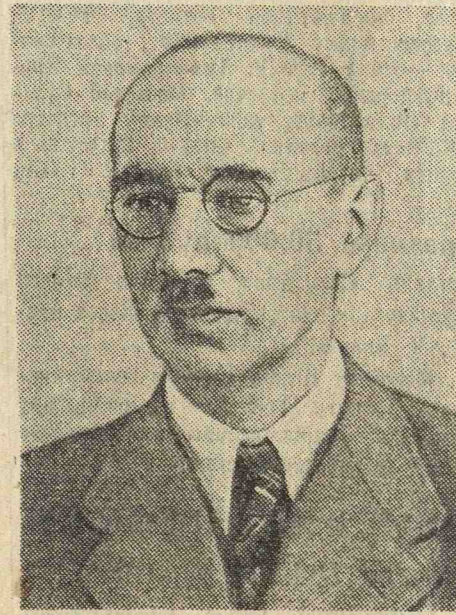
М. И. Гуревич. Конструктор.