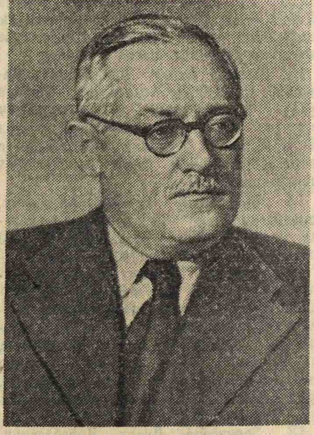
А. Я. Вышинский. Академик.