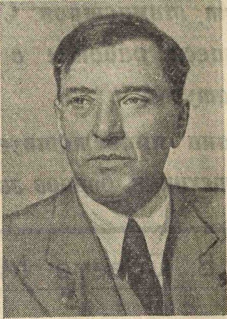
И. П. Разенков. Действительный член Академии медицинских наук СССР.