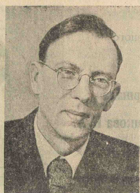
П. А. Павленко. Писатель.