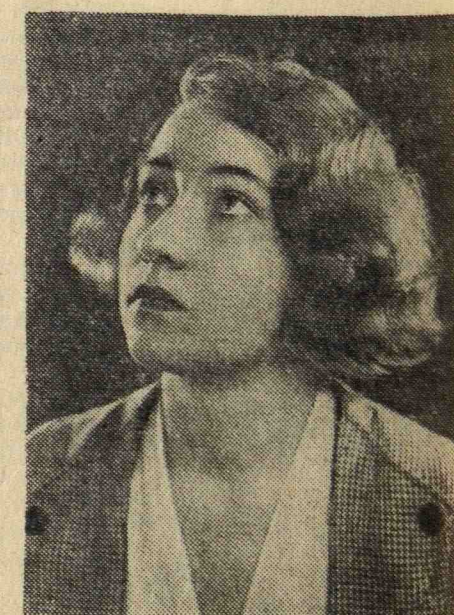
Г. С. Уланова. Балерина.