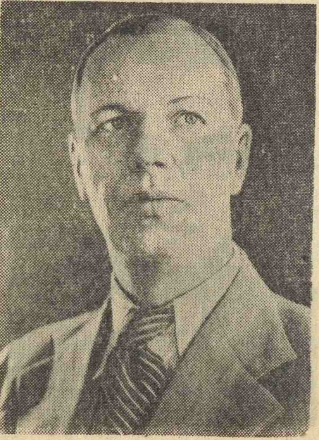
Н. П. Охлопков. Режиссер.