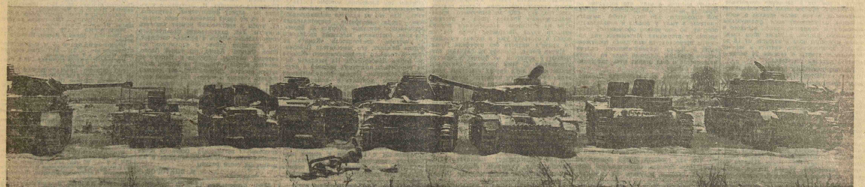
Белорусский фронт. Мозырское направление. Трофеи наших войск. Немецкие танки.