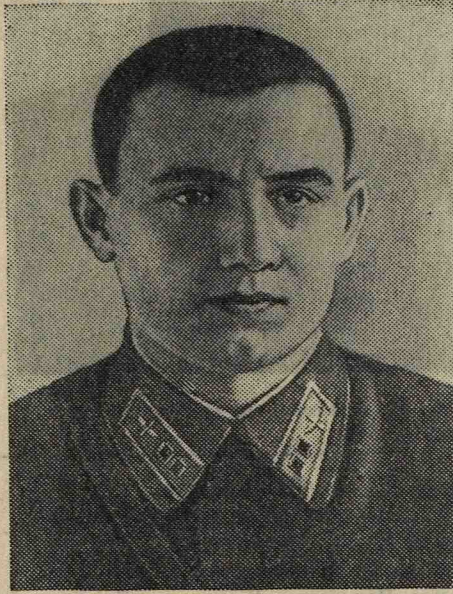
Герой Советского Союза лейтенант В. Г. Камешичков.