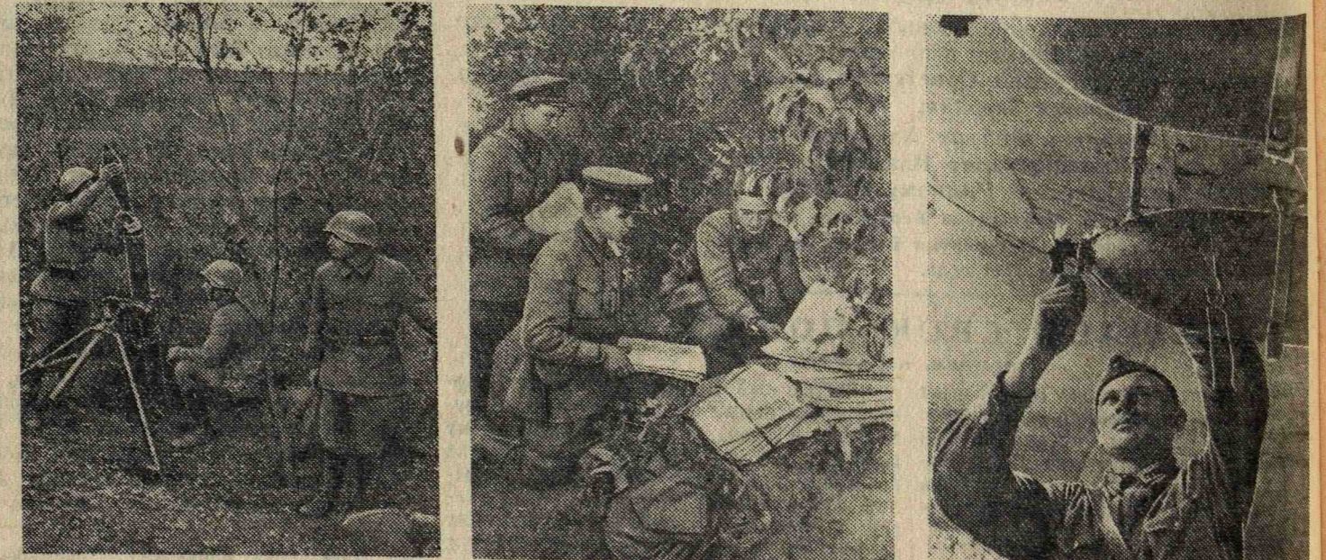
Действующая армия. На снимках (слева направо): 1. Минометчики ведут огонь по врагу. 2. Отправка газет в подразделение зенитной части. 3. Подготовка самолета к боевому вылету. Воевтехник 2-го ранга тов. Малков подшивает бомбы.