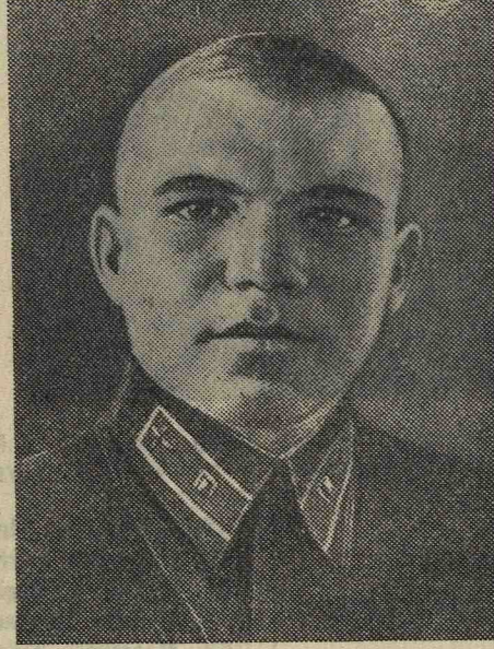
Герой Советского Союза младший лейтенант С. Г. Ридный.