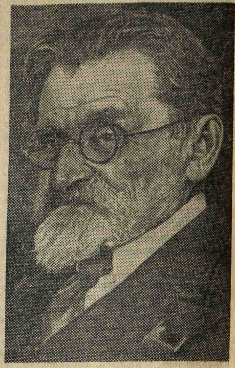
Умер Феликс Кон. Шесть десятков лет своей жизни Кон отдал великому делу борьбы с темными силами реакции. Ваторгам, тюрьмам, ссылкам пыталось царское правительство погасить его волю борца. Но Феликс Кон принадлежал к числу тех людей, для которых трудности и опасности революционной борьбы служат источником новых сил, новой энергии. Образ Феликса Кона незабываем.