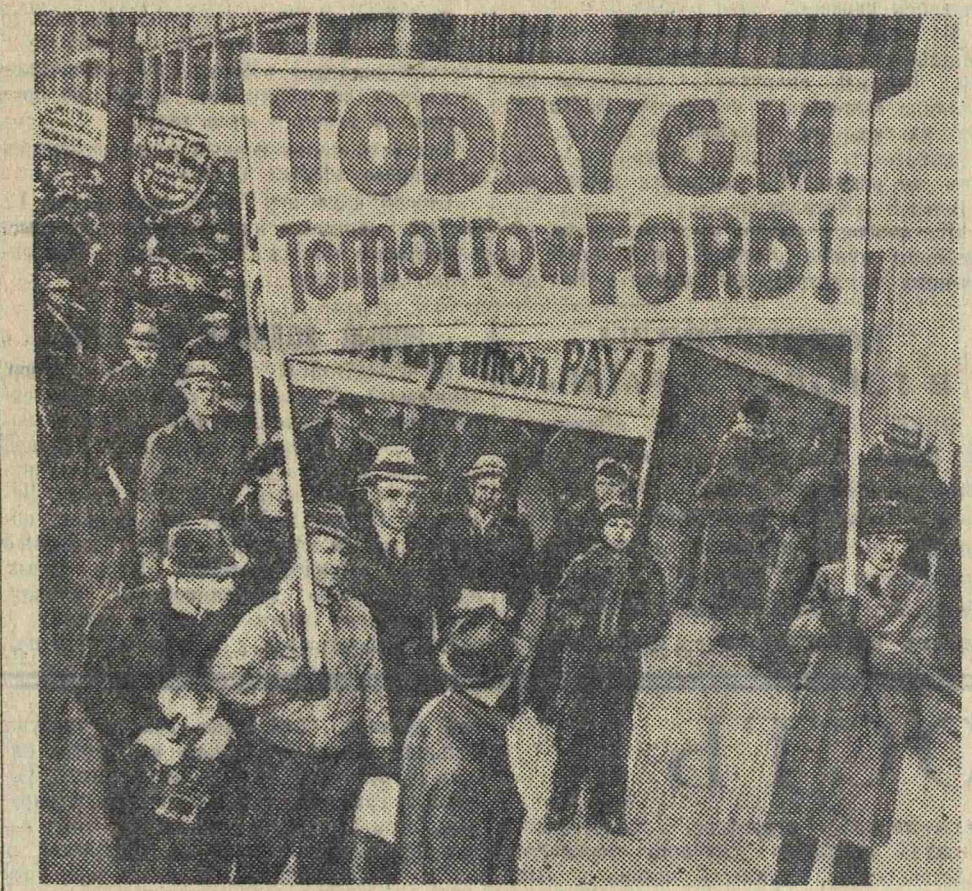
Забастовка рабочих автомобилестроения в США. На снимке: пикет бастующих рабочих у завода Джeneral Моторс, в Детройте (штат Мичиган). Надпись на плакате: «Сегодня Джeneral Моторс, а завтра Форд!».

ГЕЛЬСИНГФОРС, 5 февраля. (ТАСС). Газета «Гельсингинг саномат» сообщает, что отдел печати финляндского военного ведомства разрабатывает вопрос о подготовке работников печати и рекламы для использования их в разведывательных частях армии в случае войны. Генеральный штаб организует для этой цели особые курсы, программа которых утверждена главнокомандующим армией. Первые занятия начнутся 21 февраля. Слушатели примут участие в предстоящих военных маневрах в районе Соргавала (близ восточной границы Финляндии). Окончившие курсы будут зачислены в резерв разведывательной части армии.