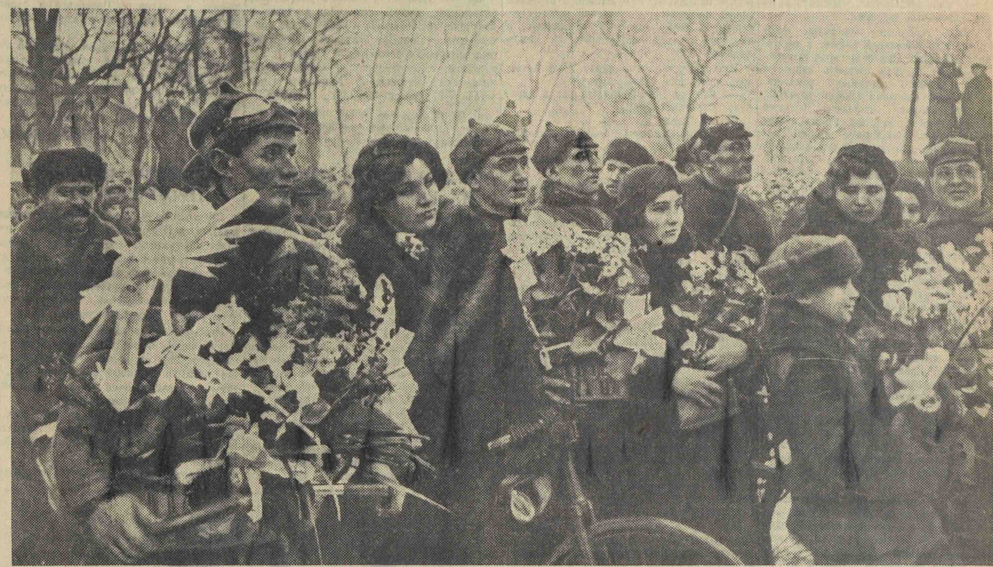
На финише велосипедного пробега вдоль границ СССР. Пограничники — участники пробега у стадиона «Динамо».

Врагам страны социализма никогда не понять этих чувств! Злоба врагов растет из их душевной пустоты и моральной обреченности. Троцкистские фашисты, эти гнусные отребья человечества, ржались во всевозможные личности, живут двойной жизнью: внешне маскируясь, они пролают нашу родину, вредят и пакостят. Они идут против высшего закона нашей жизни, против нашей родины, против социализма и должны беспощадно уничтожаться.