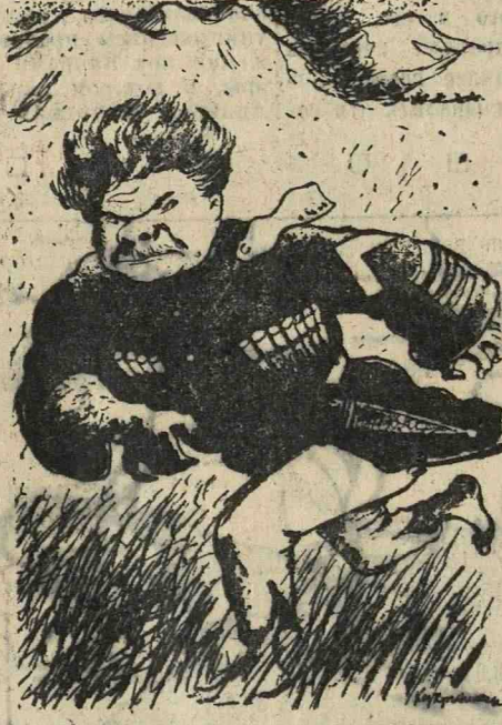
Спых ШКУРО — по зверству — волком,