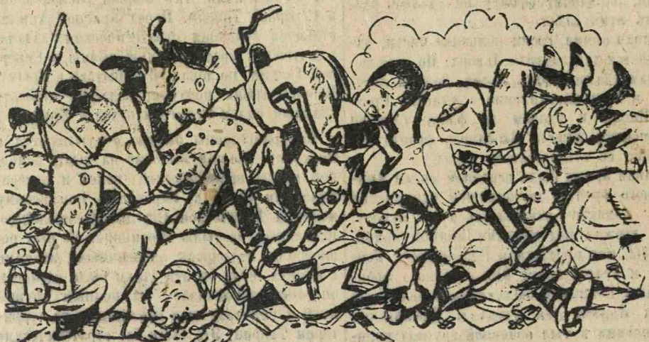
Рис. Б. Ефимова.