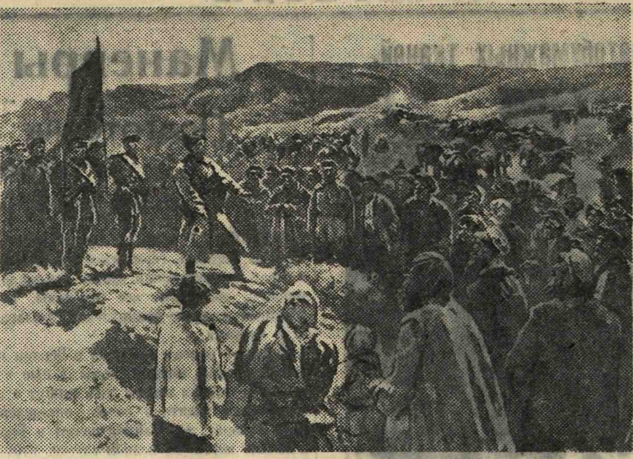
«На пути к Царицыну». Картина художника М. Грекова.

Карты делают люди, но люди должны быть точны, как часы. Смысл составления карт не только в том, чтобы иметь карты здесь, в Москве, но и в том, чтобы с ними отдаленный пункт страны своевременно и быстро получил проанализированные сведения о погоде на всем Европейском материке. Вот почему в кабинетах, в приемных и перелетных радиостанциях, на транзитном узле метеорологической службы ни днем ни ночью не прекращается напряженная работа. По линиям и коротким волнам, по проводам и телефону тысячи станций, метеорологи, моряки, пилоты, железнодорожники, агрономы, — все, чья