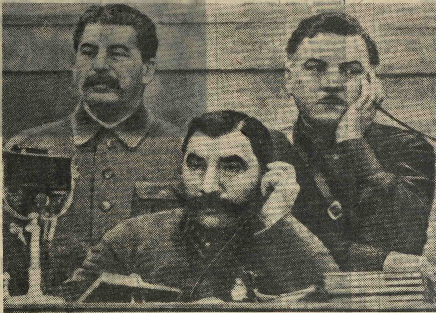
Товарищи Сталин, Ворошилов и Буденный в президиуме VII Всесоюзного Съезда Советов.

Если пятнадцать лет назад пол ударил красной коннице раскатысь, как солома, белые армии и шатались целые государства, то теперь этот большевистский таран способен ударить с удвоенной силой. На полный разгром и уничтожение обречен всякий, кто поднимет оружие на нашу великую родину.