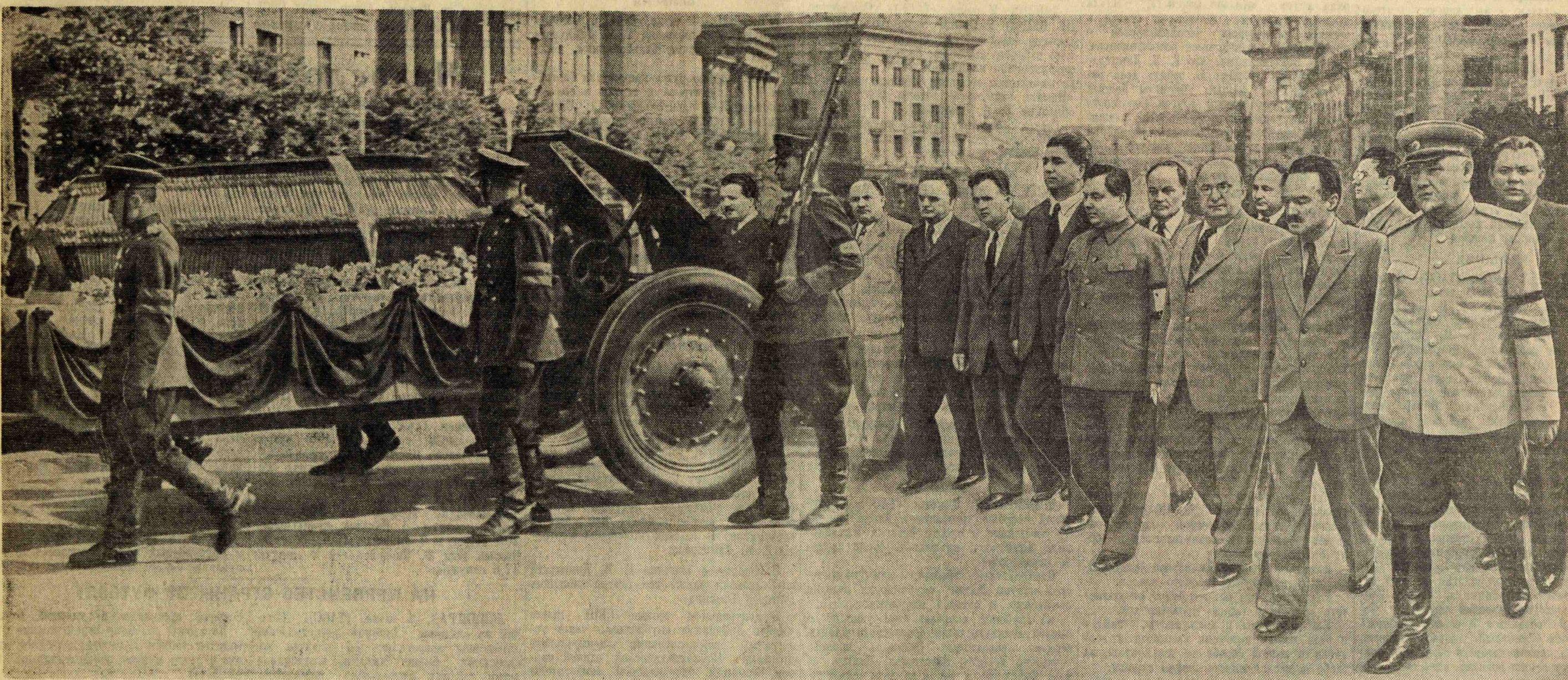
Проводы тела покойного Георгия Михайловича Димитрова в Болгарию. Траурная процессия из Дома Союзов направляется на Белорусский вокзал. За гробом идут товарищи Антон Югов, Л. М. Каганович, Н. М. Шверник, Георгий Чанков, Вилко Червенков, Г. М. Маленков, М. Ф. Шкирятов, Л. П. Берия, П. К. Пономаренко, А. И. Микоян, М. А. Суслов, Н. А. Булганин, Г. М. Попов.