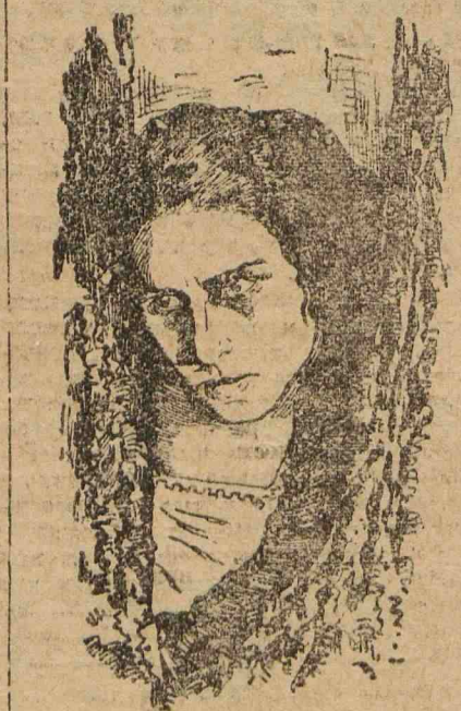
«Лесной зверь»—Постановка ВУФКУ (Артистка Гоарек).

В Одессе уже приступлено к постановке картины «Марика», под режиссурой Лудина. В работе большая историческая картина «Крова-