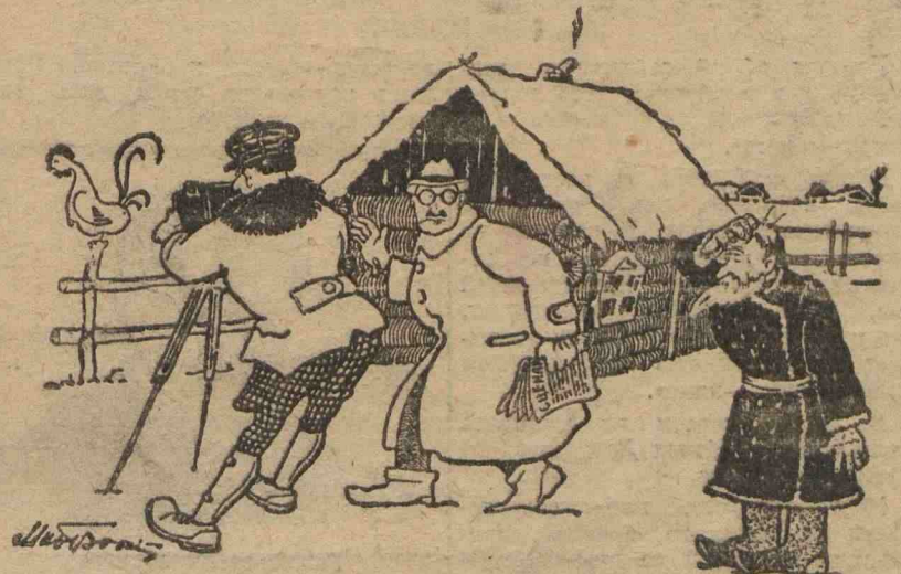
Крестьянин: Что ж вы петуха моего снимаете, а меня нет? Режиссер: Ничего не поделасшь товарищ уж больно вы те фотогеничны...

Не «фотогеничность» терзает есть больше предразсудок режиссера-зоржанина, любящего фотогению фрака и крахмальной машинки. (Из статьи «Кино-журнала АРК».)