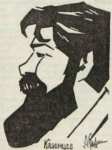
Председатель Правления „Госкино“

«В угаре нэпа» — сценарий В. Гусмана, постановка Светозарова, оператор Дорн, закончена и выпускается в прокат конторой «Госкино». Картина рисует красного директора, прошедшего угар нэпа, тюрьму и вновь переродившегося и поступившего простым рабочим в тот же завод.