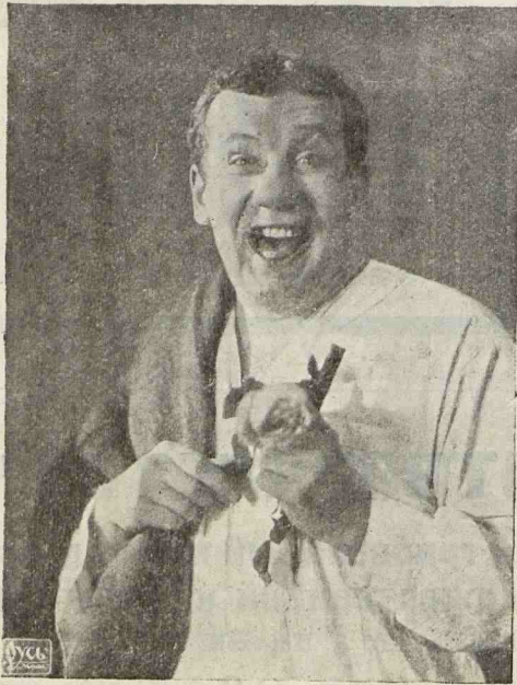
И. В. Ильинский в роли Бухгалтера Сахаротреста.