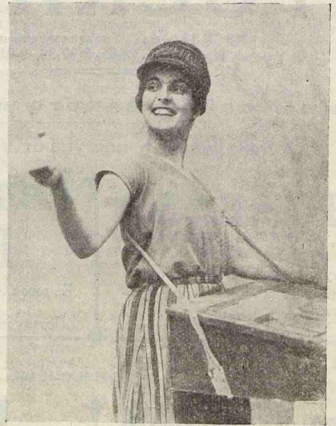
Ю. И. Солнцева в роли Папиросницы от Моссельпрома