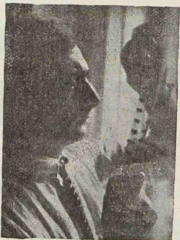
Дзига Вертов монтирует «Кино-Глаз»

ренная и замедленная съемка, хотя в них и нет ничего нового. К сожалению, с этими фокусами Вертов несколько пересолил. Переходим к основному — к оценке картины, с точки зрения идеологической. Здесь — ахилесова пята Вертова.