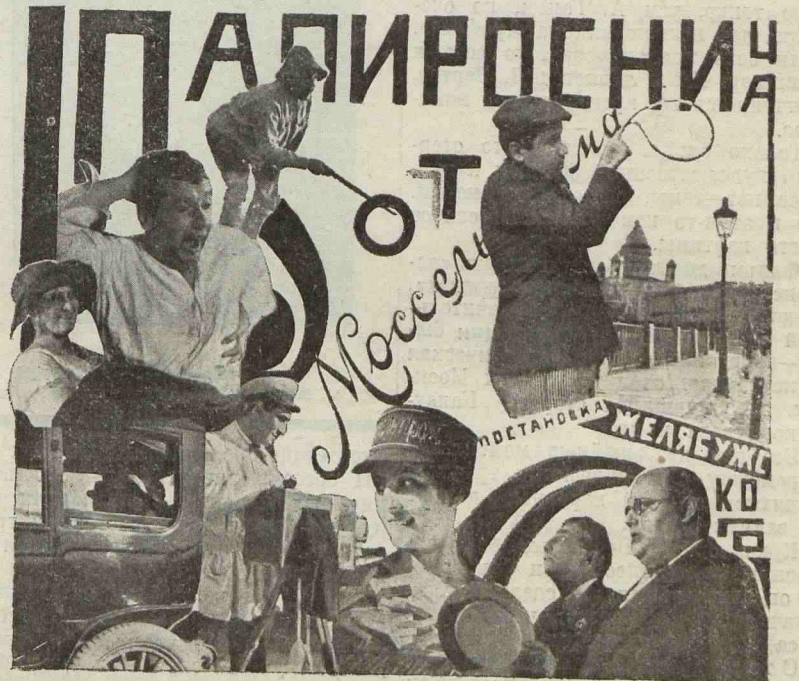
ПОСТАНОВКА „РУСЬ“ (РЕЖИССЕР Ю. ЖЕЛЯБУЖСКИЙ).