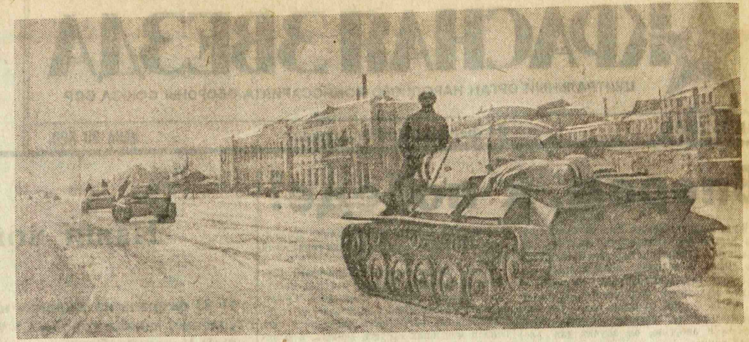
В освобожденном Ворошиловграде. Советские танки проходят по улицам города.