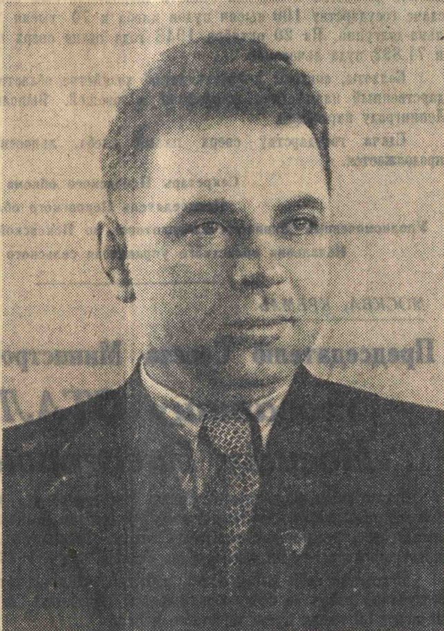
Тов. Н. А. Михайлов, секретарь Центрального Комитета ВЛКСМ

Задача состоит в том, чтобы мы и впредь воспитывали здоровую, идейно и физически закаленную молодежь, готовую и способную преодолевать трудности в любых условиях и любой погодой, с честью и достоинством защищать и отстаивать интересы нашей Родины — Союза Советских Социалистических Республик. (Аплодисменты).