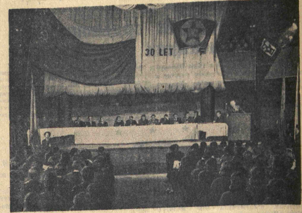
Молодежь Праги в торжественной обстановке отметила тридцатилетие ВЛКСМ. В огромном зал славянского Дома собралось более 3 тысяч юношей и девушек. В торжественном заседании приняли участие заместитель премьер-министра Чехословакии Эд. Фирлинггер, представители общественных организаций, делегаты фабрик, заводов, учебных заведений. На снимке: в зале славянского Дома в Праге во время торжественного заседания.