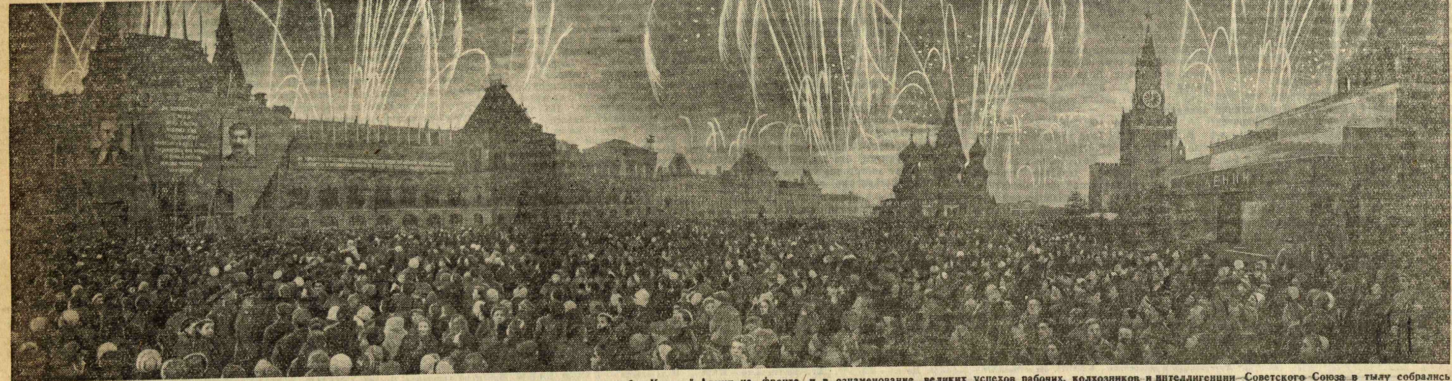
КРАСНАЯ ПЛОЩАДЬ В МОСКВЕ, 1 МАЯ В 20 ЧАСОВ. Сюда в момент салюта в честь исторических побед Красной Армии на фронте и в ознаменование великих успехов рабочих, колхозников и интеллигенции Советского Союза в тылу собралась тысяча москвичей. На снимке: общий вид Красной площади в момент салюта.

Из этого числа на долю Канады приходится 750 тыс. человек, Новой Зеландии — 197 тыс., Южно-Африканского Союза — 271 тыс., Австралии — 800 тыс. чел. В индийской армии имеется около 2 млн. индусов, помимо контингента, прибывших в Англию. Английские колонии дали 250 тыс. чел. Численность английской армии составляет примерно 5.250 тыс. человек.