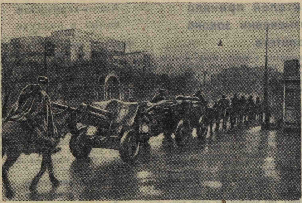
ростов-на-Дону в эти дни. Н-ский артиллерийский полк проходит по улицам города, направляясь на фронт.